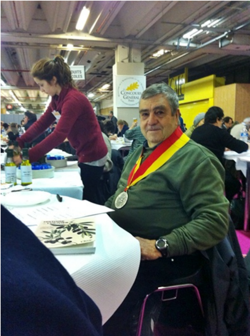
Dégustateur CGA Paris Produits oléicoles