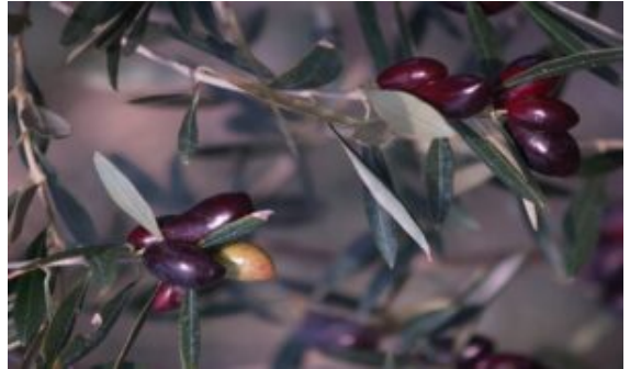
Olives lucques sur olivier Lucal

Un mystère entoure la production des fruits et les discussions n'en finissent pas sur les causes qui obèrent les récoltes, en excluant du présent propos l'évolution du fruit vers sa maturité. Le jeune fruit va grossir et subir les attaques plus ou moins fortes de parasites. Nous allons d'abord nous intéresser à la fleur et à la floraison.